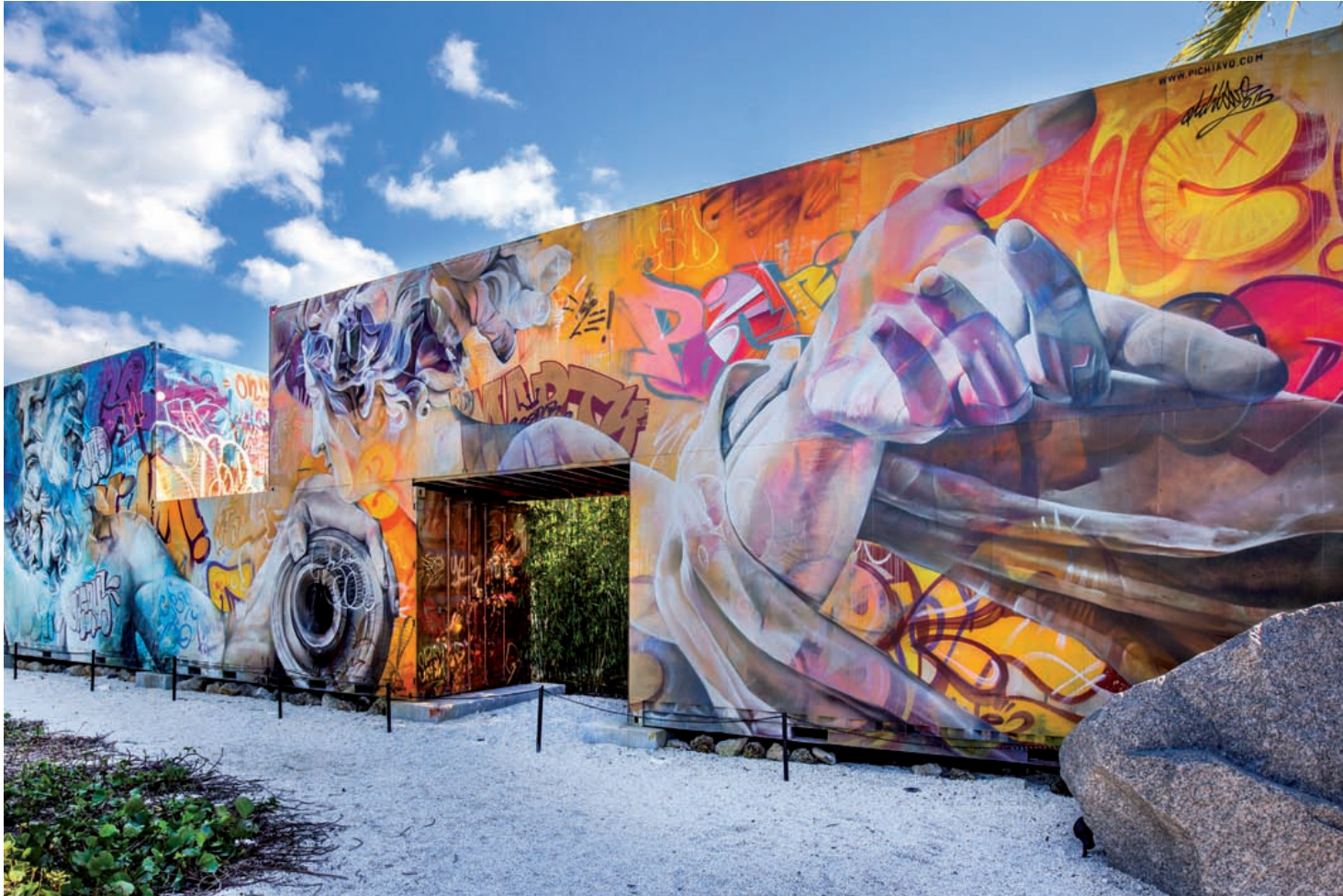
Création de PichiAvo au Wynwood Walls Garden, Miami © Jean-Albert Coopmann