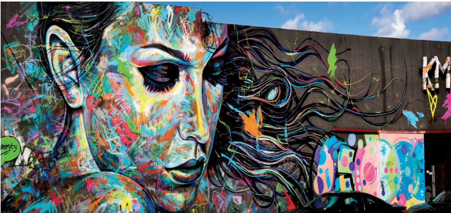
Street art dans une rue du quartier Wynwood, Miami