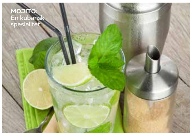
MOJITO: En kubansk spesialitet.