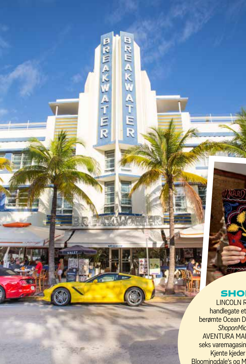
SE OPP: Glem ikke å ta en titt på de vakre fasadene når du på shoppingtur i byen.

spansk og de holder trofast på sine kubanske tradisjoner. Og det er bra, for dette nabolaget er rett og slett en liten skatt.