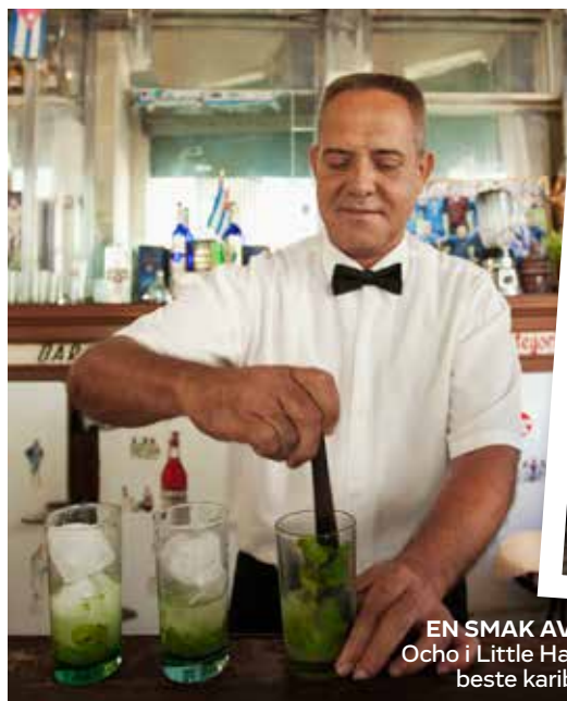
EN SMAK AV CUBA: I Calle Ocho i Little Havana får du de beste karibiske drinkene.

TURISTBUSSE: Hop-On, Hop-Off-bussene har flere ruter og stopper ved de aller fleste, kjente severdighetene. En både morsom og praktisk måte å utforske byen på. Sjekk Bigbustours.com/miami