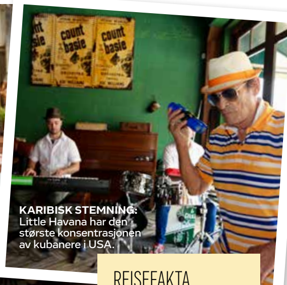
KARIBISK STEMNING: Little Havana har den største konsentrasjonen av kubanere i USA.